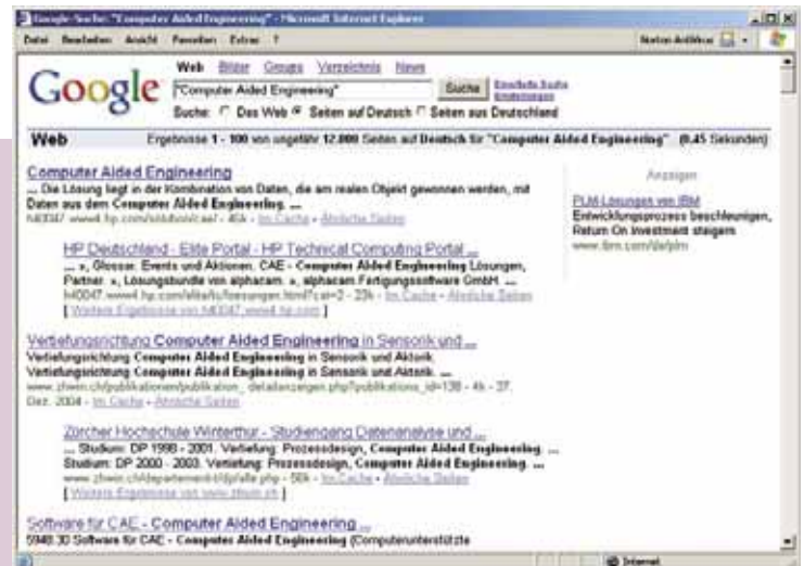
Bild 5 Google liefert für „Computer Aided Engineering“ rund 12 000 Treffer

Fischer wechselt noch einmal in die Heizungsmodule und zeigt, wie das Tagesgeschäft leichter geht: Änderung von U-Werten, verschobene Wände, andere Heizkörper im Auftrag als ausgeschrieben. Je nach Projektzustand lassen sich dann die betroffenen Bauteile neu dimensionieren oder bereits verbaute Anlagenteile fixieren, um die Konsequen-