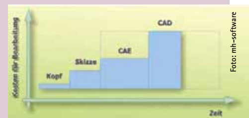
Bild 2 Durch den alternativen Einsatz von CAE sind Änderungen schnell, einfach und kostengünstig realisierbar