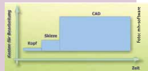
Bild 1 Zu früher Einsatz von CAD führt durch aufwendige Änderungen zu hohen Planungskosten

In der Praxis hat sich gezeigt, dass die zeichnerischen Fähigkeiten von CAE häufig sogar zum Erstellen von Ausführungsplänen geeignet sind, insbesondere für die Einstrich-Darstellung von Heizungs- und Trink-/Abwassernetzen. In diesem Fall kann auf den abschließenden Einsatz eines CAD-Systems verzichtet werden. Je nach Durchgängigkeit des CAE-Tools ist der Zeitgewinn gegenüber einer CAD-Lösung dann erheblich. Für einen höheren Detaillierungsgrad, z.B. bei der Planung einer Heizzentrale oder für Kollisionsprüfungen, kann auf den Einsatz eines CAD-Systems jedoch nicht verzichtet werden.