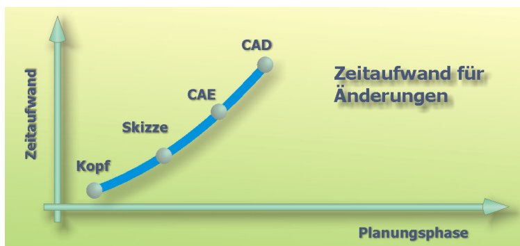
Bild 2: Zeitaufwand für Änderungen mit den jeweiligen Hilfsmitteln/Werkzeugen