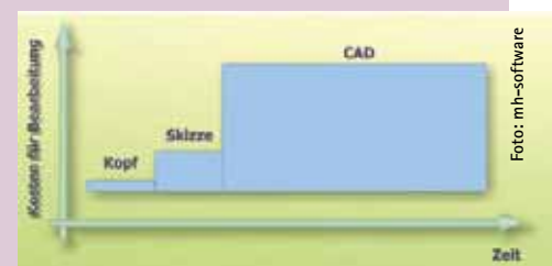
Bild 1 Zu früher Einsatz von CAD führt durch aufwendige Änderungen zu hohen Planungskosten

In der Praxis hat sich gezeigt, dass die zeichnerischen Fähigkeiten von CAE häufig sogar zum Erstellen von Ausführungsplänen geeignet sind, insbesondere für die Einstrich-Darstellung von Heizungs- und Trink-/Abwassernetzen. In diesem Fall kann auf den abschließenden Einsatz eines CAD-Systems verzichtet werden. Je nach Durchgängigkeit des CAE-Tools ist der Zeitgewinn gegenüber einer CAD-Lösung dann erheblich. Für einen höheren Detaillierungsgrad, z. B. bei der Planung einer Heizzentrale oder für Kollisionsprüfungen, kann auf den Einsatz eines CAD-Systems jedoch nicht verzichtet werden.