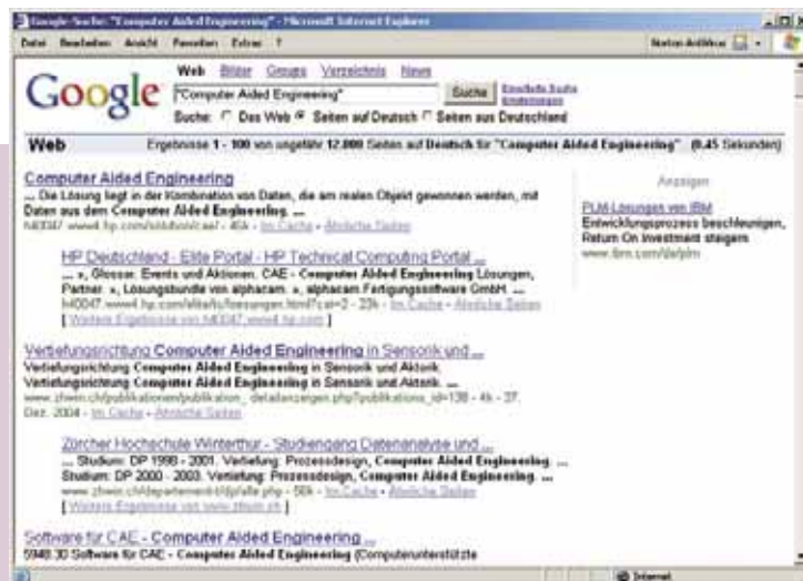
Bild 5 Google liefert für „Computer Aided Engineering“ rund 12 000 Treffer

Fischer wechselt noch einmal in die Heizungsmodule und zeigt, wie das Tagesgeschäft leichter geht: Änderung von U-Werten, verschobene Wände, andere Heizkörper im Auftrag als ausgeschrieben. Je nach Projektzustand lassen sich dann die betroffenen Bauteile neu dimensionieren oder bereits verbaute Anlagenteile fixieren, um die Konsequen-